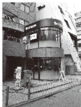
自由が丘駅南口からすぐ！丸い建物の2階がお店です。

〒152-0035 東京都目黒区自由が丘1-8-9 岡田ビル2F 営業時間 10:00~18:00(18:00受付終了) 定休日 火曜日および年末年始