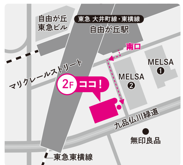
東急大井町線・東横線「自由が丘駅」南口を出て徒歩1分南口を出て右、MELSA②の角を左に曲がる